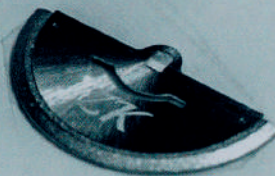
PŘED VÁNOCI FRÝDECKO-MÍSTECKÝ PRIM představí nový plastický rotor.

Frýdecko-místecký Prim používá dva typy tisku číselníků: ruční a mechanický tampónový tisk. Cílem je zdokonalit nejen samotné techniky tisku, ale také barvy, které se používají. V MPM-Quality proto právě probíhá školení na integraci zcela nových švýcarských barev. „Je to pro nás určitě zajímavý posun. Vedle číselníků z materiálů jako damašek, meteorit, perleť nebo porcelán si nově pohráváme s myšlenkou začlenit také karbon. Díky tomuto školení budeme schopni našim zákazníkům